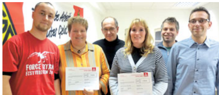
Vertreter beider Vereine sowie der Erste und Zweite Bevollmächtigte (im Hintergrund) der IG Metall bei der Übergabe der Spendenschecks.

Der Verein Utopia in Frankfurt/Oder setzt sich insbesondere für die Integration ausländischer Mitbürger ein und stellt sich rechtsextremen, Rassen diskriminierenden und antidemokratischen Tendenzen in ihrer politischen Jugendbildungsarbeit entgegen. Unter dem Dach von