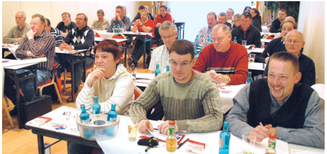
Vertrauensleuteschulung am 28. November

Redaktion: Sieglinde Merbitz (verantwortlich)