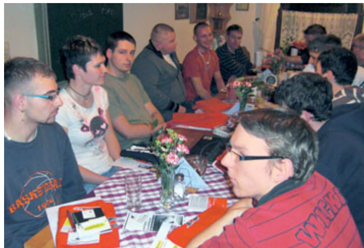
Treffen mit den Bosch-Azubis

Bei der letzten Ortsjugendausschuss-Sitzung haben wir vier neue Mitglieder begrüßen können. Sehr erfreulich ist, dass nun auch zwei bisher noch nicht vertretene Betriebe dabei sind. Jeder jugendliche IG Metalller (bis 27 Jahre) ist bei uns herzlich willkommen. Im November haben wir verschiedene Treffen organisiert, die den Auszubildenden sehr gut gefallen haben. Insgesamt haben 27 Azubis das Angebot genutzt, mit uns in Kontakt zu kommen. Seit August haben wir über 50 Neuaufnahmen im Azubi-Bereich. ■