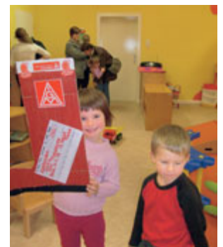
Die symbolischen Schecks wurden in Form eines Nikolausstiefels übergeben.

An der Fragebogenaktion im Rahmen der Kampagne »Gemeinsam für ein gutes Leben« beteiligten sich im Bereich der IG Metall Riesa Kolleginnen und Kollegen aus 17 Betrieben und der außerbetrieblichen Gewerkschaftsarbeit. Insgesamt wurden 1129 Fragebögen ausgefüllt. Die Gesamtsumme in Höhe von 1129 Euro, die die IG Metall Riesa vom Vorstand dafür erhielt, wurde an drei Kindereinrichtungen aufgeteilt. Allen, die das ermöglicht haben, ein herzliches Dankeschön.