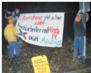
Die BGH-Azubis in Aktion

Am 8. Dezember um 6 Uhr morgens trafen sich die Azubis der BGH Edelstahlwerk Freital am Tor, um ihre Aktion zu starten. Sie fordern: »Führt endlich die 24-monatige Übernahme bei uns ein.« Ein ausführlicher Bericht folgt in der nächsten Ausgabe.