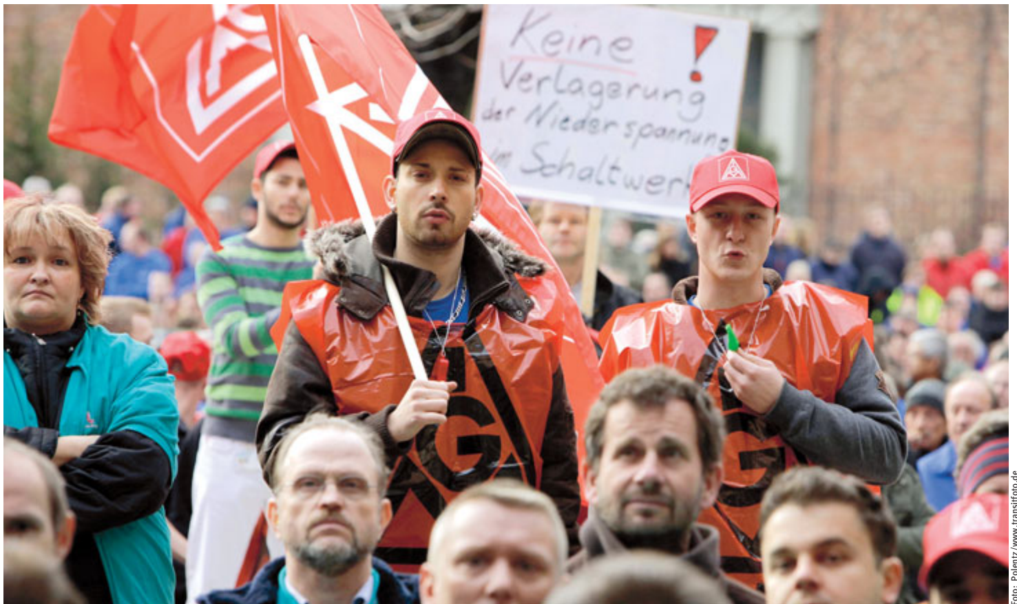
Verlagerung von Fertigung trotz schwarzer Zahlen? Im Berliner Siemens-Schaltwerk kann das keiner nachvollziehen.