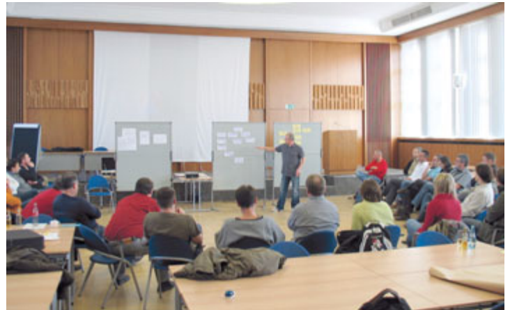
Vertrauensleute der Automobilmanufaktur Dresden zur Klausur im Dresdner Volkshaus.

»Schwerpunkt für uns bleibt die Standortentwicklung und Beschäftigungssicherung. Der gültige Tarifvertrag schreibt 400 Arbeitsplätze in Dresden fest und ist