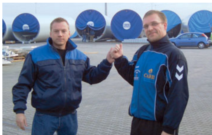
Die neuen Betriebsräte.